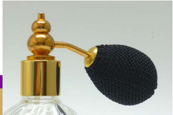
Tête / Head / Kopf : 07